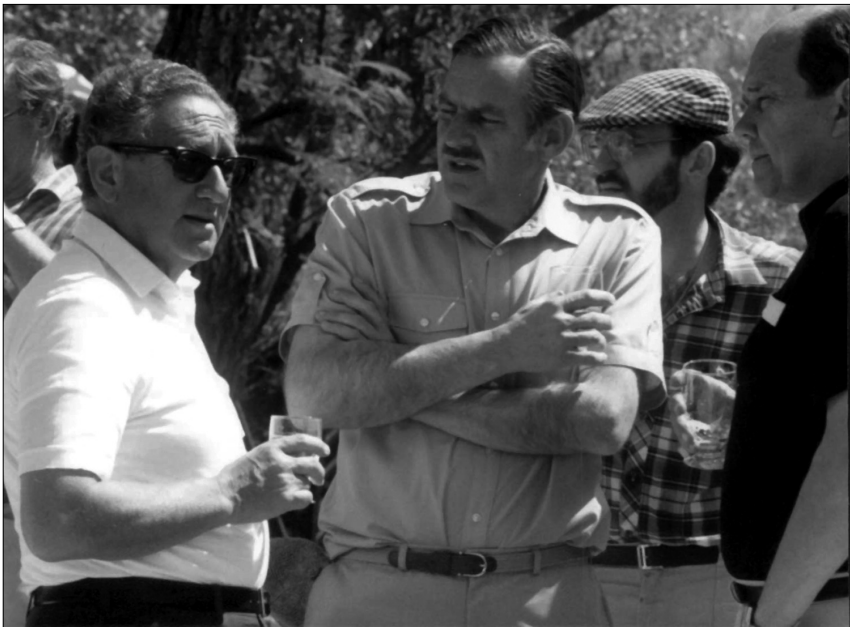
Gesprekke in die veld met Henry Kissinger (voor links) en Magnus Malan (voor regs).