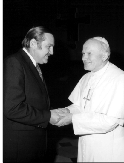
By pous Johannes Paulus II, Oktober 1979. "Ons het persoonlike rapport gevind."